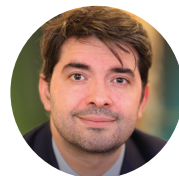
Aurélien CARON Président d'Amiens Ville d'Avenir